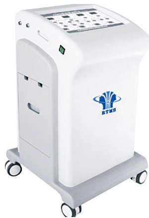
RTMS 经颅磁 癫痫病治疗仪